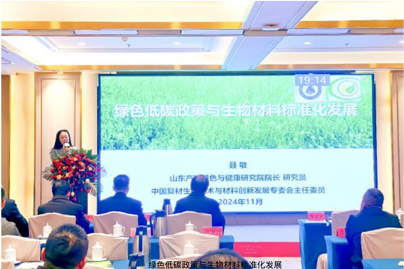
绿色低碳政策与生物材料标准化发展 山东产业技术研究院中国复合材料协会生物技术与材料专业委员会副主任 聂敏